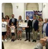
Agrigento, consegnati tre Premi Laurea "Peppino Cultrera": iniziativa del Lions Club Agrigento Host