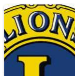
Il Lions Club Valle dei Templi anche quest'anno s'impegna a raccogliere gli occhiali usati