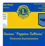
Lions Club "Agrigento Host": tutto pronto per la cerimonia di consegna dei 3 premi di laurea "Peppino Cultrera"