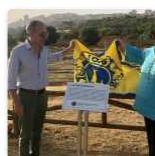
Il Lions Club Valle dei Templi dona al Parco targa braille con descrizione dell'Agorà dell'antica Akragas