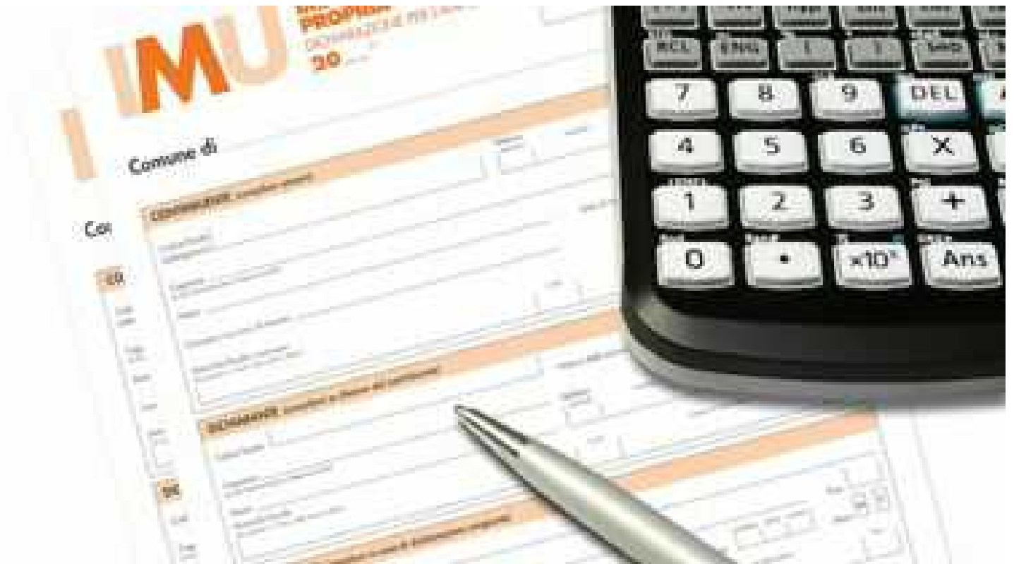
Imu non pagata dalla Provincia, San Benedetto passa a riscuotere SANGUE SULLE STRADE