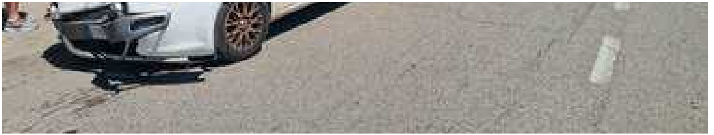
Con lo scooter si scontra con un'auto: muore uomo di 52 anni poco dopo l'arrivo in ospedale L'INTERVENTO