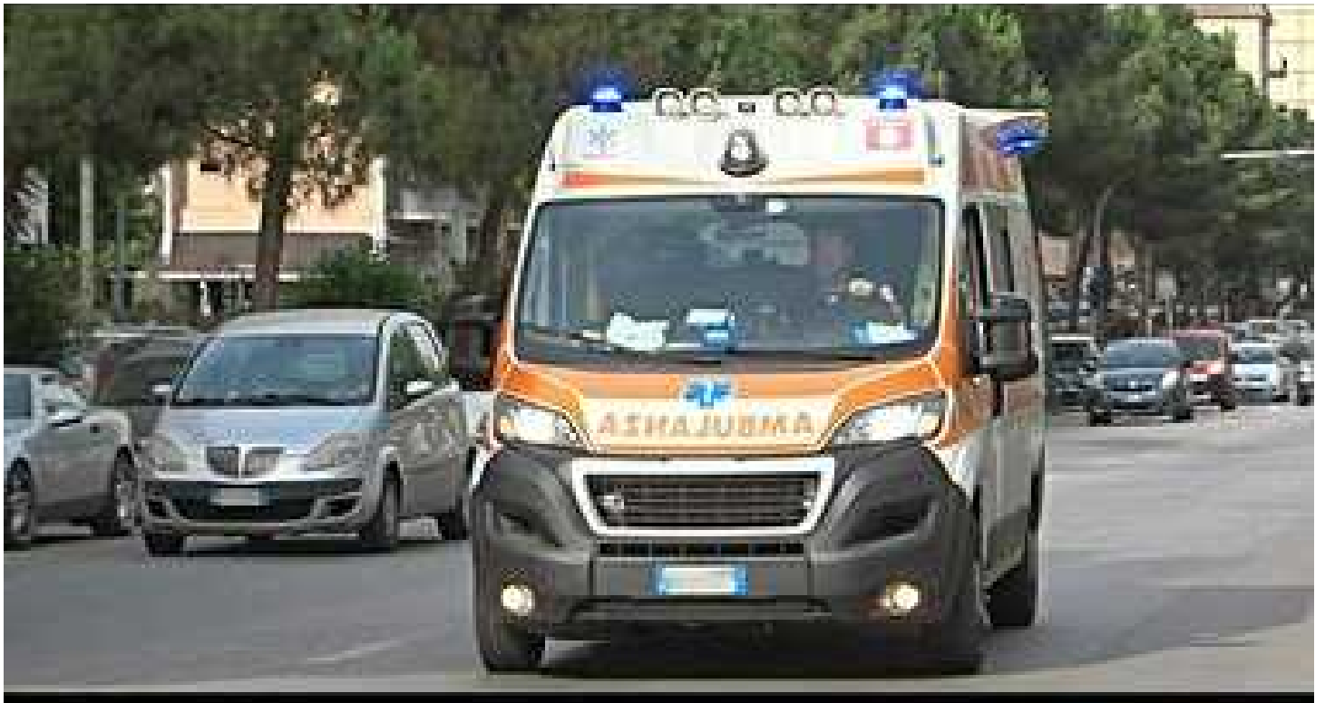
Caldo killer, malore fulminante mentre passeggia: anziano crolla sul marciapiede e muore IL BILANCIO