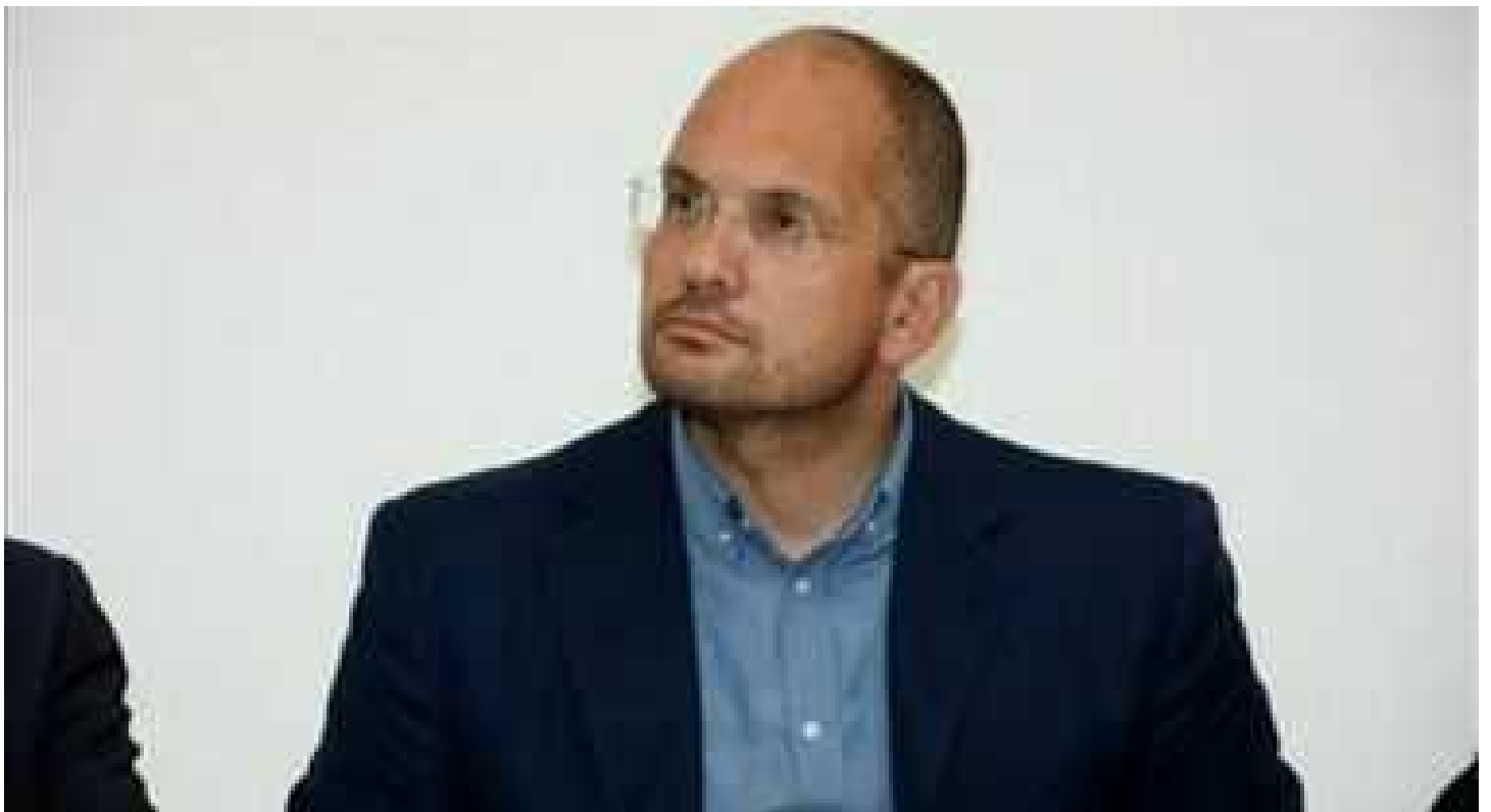
Il Piceno prova a ripartire: 9 milioni da Mise e Regione GLI APPUNTAMENTI