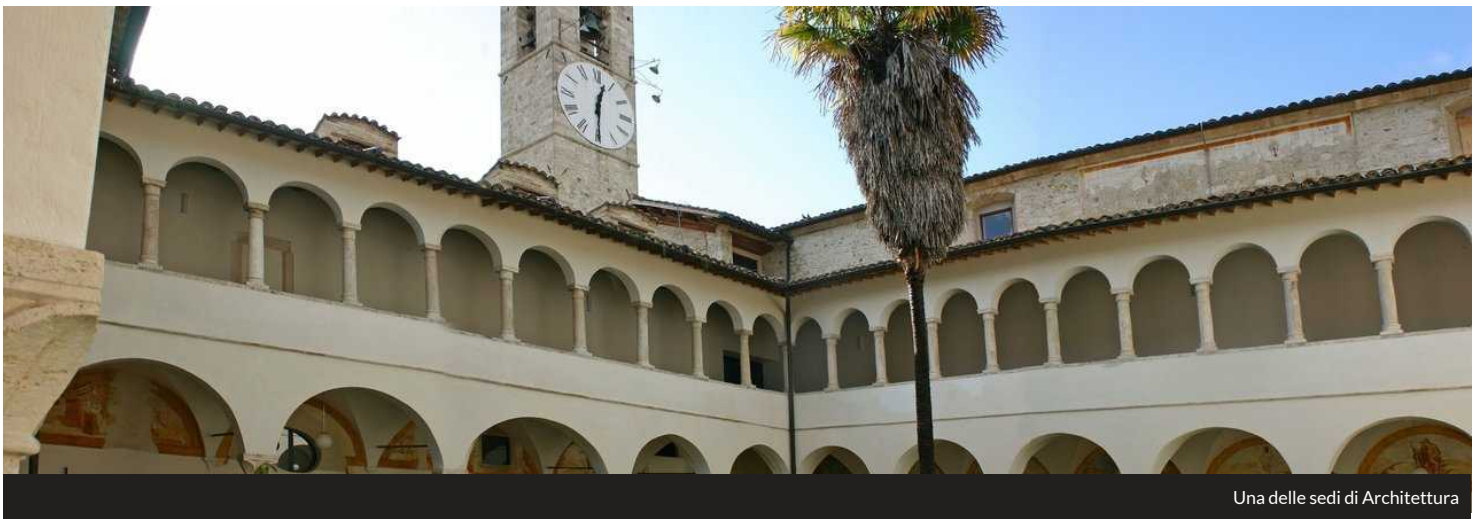
Una delle sedi di Architettura