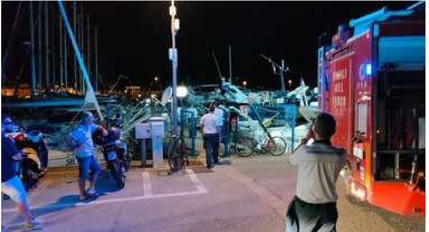
Incendio al Circolo Nautico di San Benedetto, a fuoco nella notte la barca a vela di un imprenditore LA TRADIZIONE