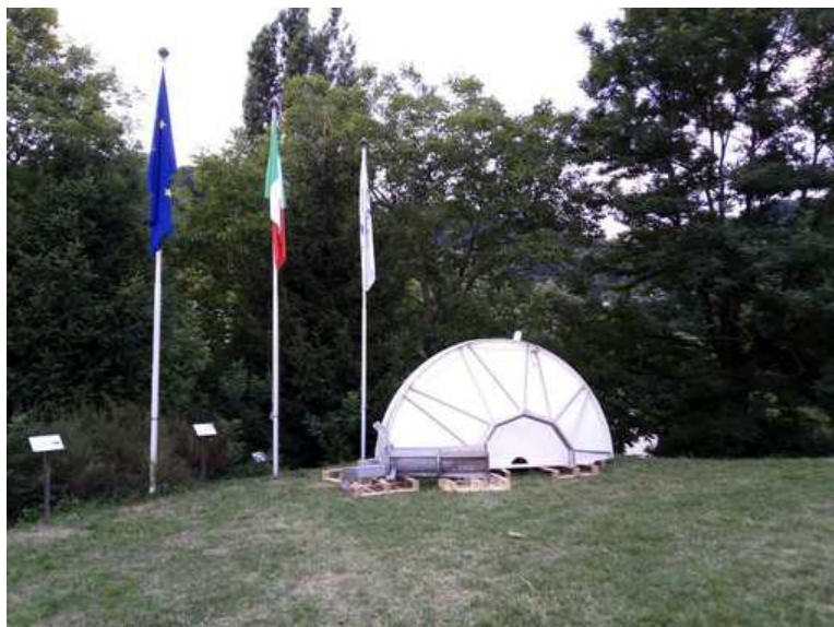
La nuova antenna da installare all'osservatorio astronomico di Luserna San Giovanni

Partono i lavori per installare la nuova antenna in grado di ascoltare frequenze superiori di onde elettromagnetiche