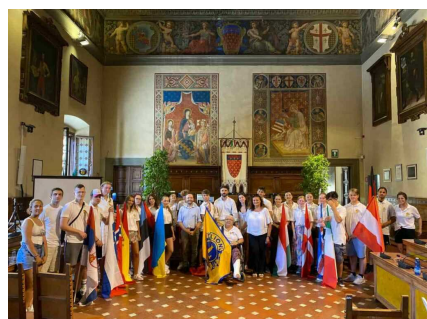
La visita in Comune

I ragazzi, che aderiscono al campo itinerante Camp Toscana, promosso dal Lions Club Prato Curzio Malaparte, dal Lions di Pontremoli e da quello di San Gimignano, percorreranno l'itinerario della Francigena in Toscana. Vivendo l'esperienza dell'ospitalità delle famiglie toscane, infatti, si muoveranno dalla via Francigena, partendo da Pontremoli e arrivando a Chiusi, proseguendo verso il mare, quindi visitando la Versilia, e recandosi anche nelle città storiche come Lucca e San Gimignano.