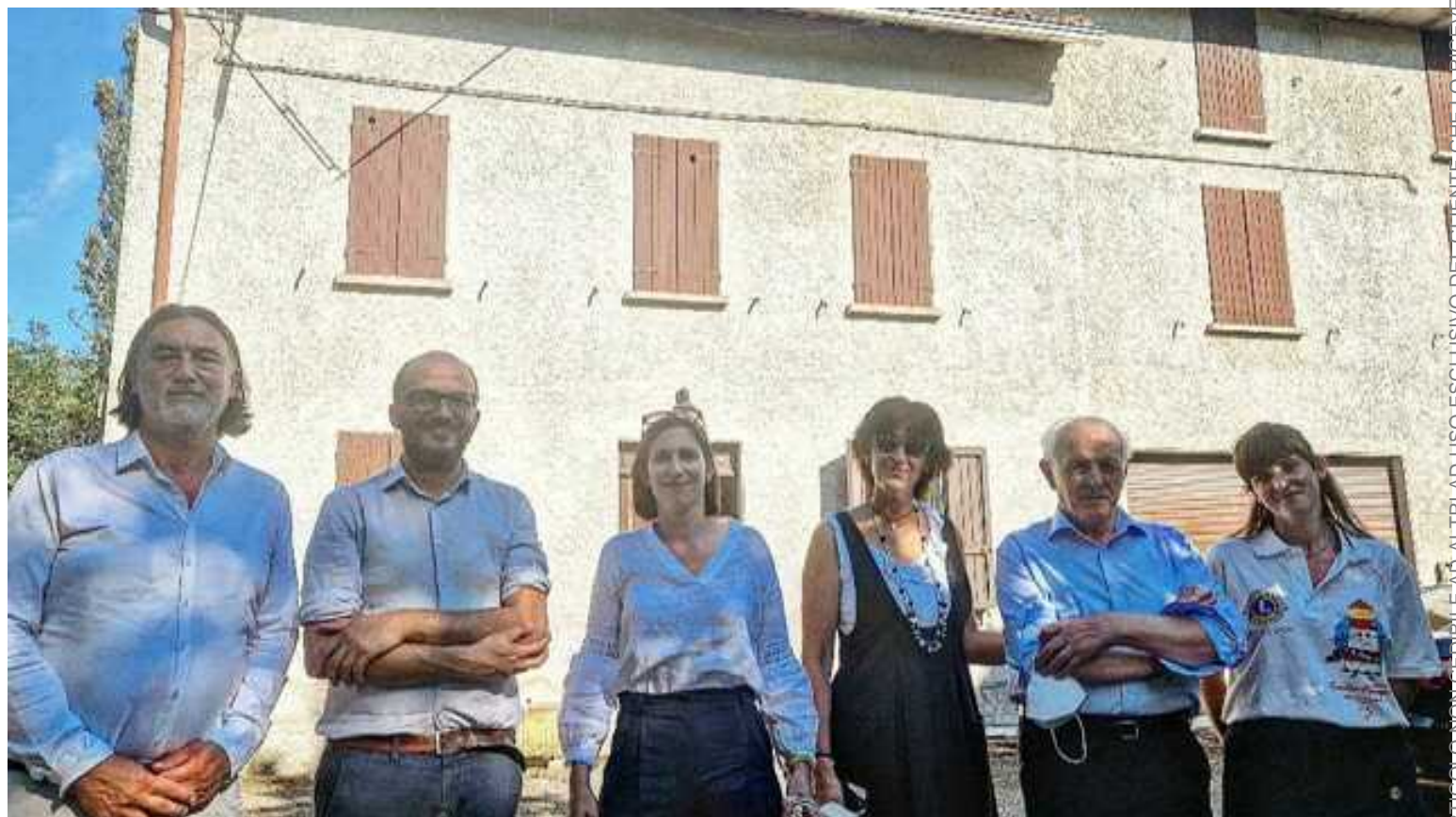
Elly Schlein, vicepresidente e Assessore al contrasto alle disuguaglianze della Regione Emilia-Romagna, durante la sua visita a Salsomaggiore

Supportare ed offrire strumenti che possano essere utilizzati per lo sviluppo di nuove strategie volte al raggiungimento di momenti di aggregazione e di accettazione di ogni peculiarità grazie ad un percorso nato per poter condividere e sostenere bambini e ragazzi con deficit e patologie diverse e anche le loro famiglie: sono i principali obiettivi del progetto RisOrsa, nato nell'ultimo biennio grazie alla tenacia dell'Associazione Onlus "Il Faro 23", che potrebbe vedere un ulteriore step con la proposta per la dotazione di una sede dove i ragazzi, attraverso attività prevalentemente manuali – quali allevamento di animali da cortile, apicoltura, orto e attività culinarie – avrebbero la possibilità di apprendere alcune importanti competenze spendibili anche in ambito lavorativo.