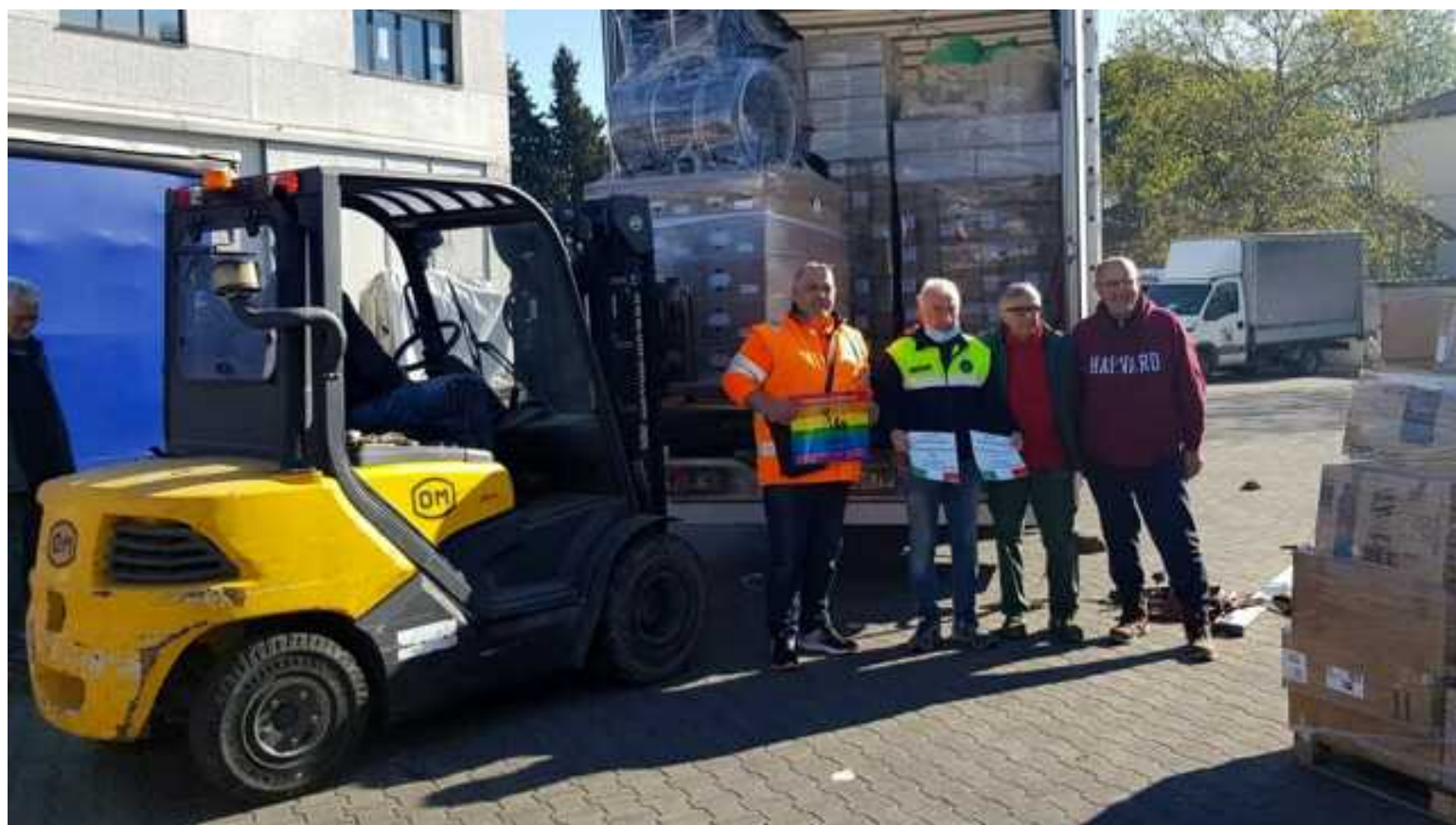
La partenza per l'Ucraina di un camion del Comitato

Ucraina, Libano, Niger e Kosovo: non c'è solo la più grande crisi internazionale in corso, quella ucraina, ma anche tante crisi sociali dimenticate e fuori dai riflettori, nell'impegno forlivese per la cooperazione internazionale, un impegno che si fonda su tre pilastri in città: il "Comitato per la lotta contro la fame nel mondo", il soggetto del terzo settore più attrezzato a Forlì nell'intervenire nei teatri umanitari più precari e pericolosi, il 66° Reggimento 'Trieste' che dà funziona da struttura logistica per la Cooperazione internazionale civile e militare, ed infine il Comune di Forlì, che intercetta i fondi e coordina il tanto lavoro dei volontari in città.