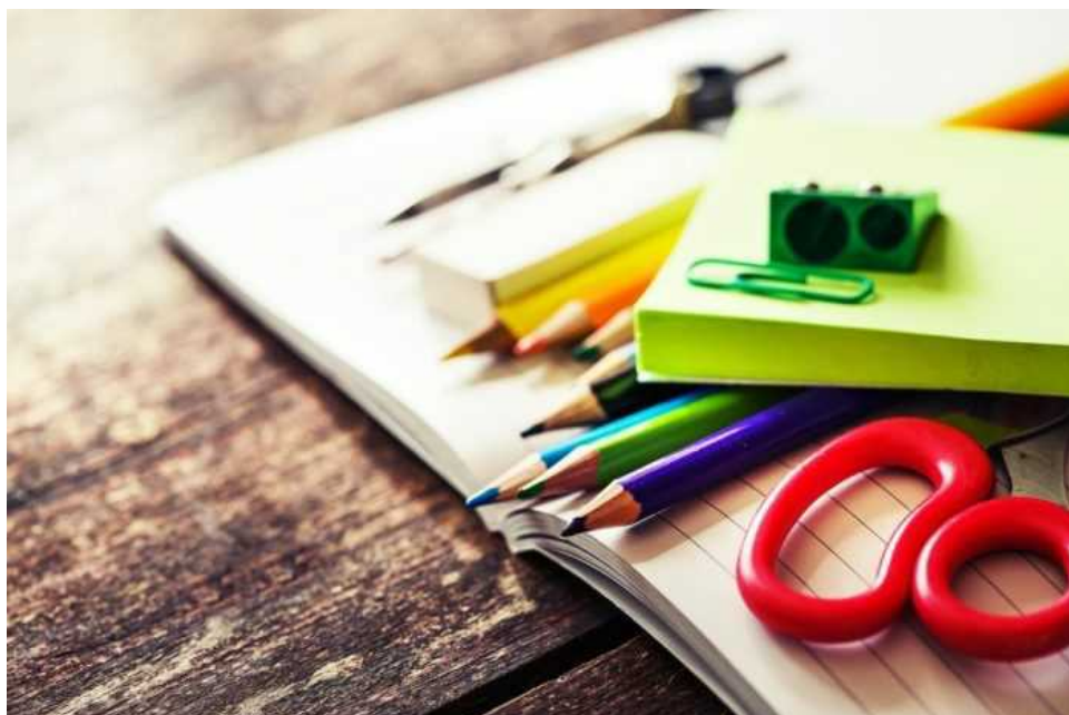
Materiale scolastico vario

La raccolta fondi per l'acquisto di materiale scolastico per le famiglie in difficoltà, che quest'anno compie dieci anni, si terrà sabato 3 settembre e sabato 10 settembre in vari supermercati del Comune