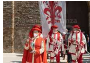
701° annuale della morte di Dante: il programma di domenica 11 settembre