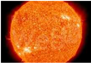
Doppio appuntamento con il Gruppo Astrofili a settembre