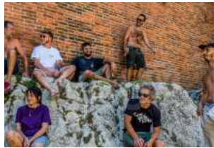
Al Museo Ugonia inaugura la mostra Spine Mixtape 2