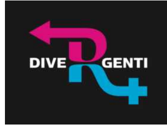
Divergenti – Festival Internazionale di Cinema Trans. A Bologna