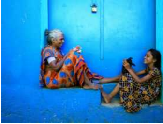
CEWE Photo Award. Our world is beautiful