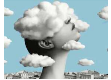
Scrittorincittà sta tomando! Da mercoledì 16 novembre