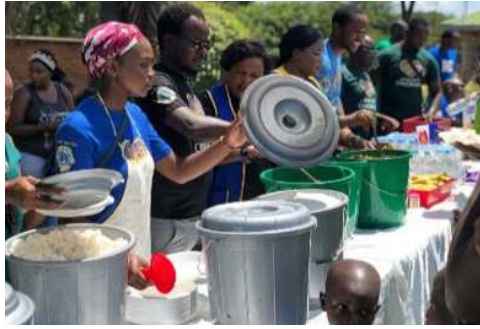
I Lions servono il pranzo durante la celebrazione della Giornata Internazionale del Cancro Infantile in Malawi.

con la Global HOPE (Hematology-Oncology Pediatric Excellence - Eccellenza nell'ematologia e oncologia pediatrica), un programma dell'Ospedale pediatrico del Texas e del Baylor College of Medicine. Lanciata nel 2017, la Global HOPE è un'iniziativa di trasformazione che sta migliorando lo standard delle cure per i bambini malati di cancro nell'Africa subsahariana.