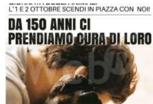
Enpa: Giornata degli Animali

Articoli correlati Di più dello stesso autore