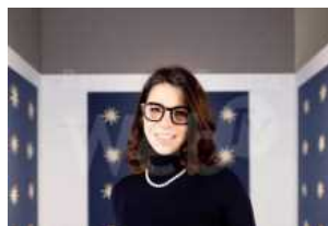
Randi: PodDARE, multilinguismo e multiculturalità, due punti di attenzione del progetto DARE che caratterizzano la città di Ravenna