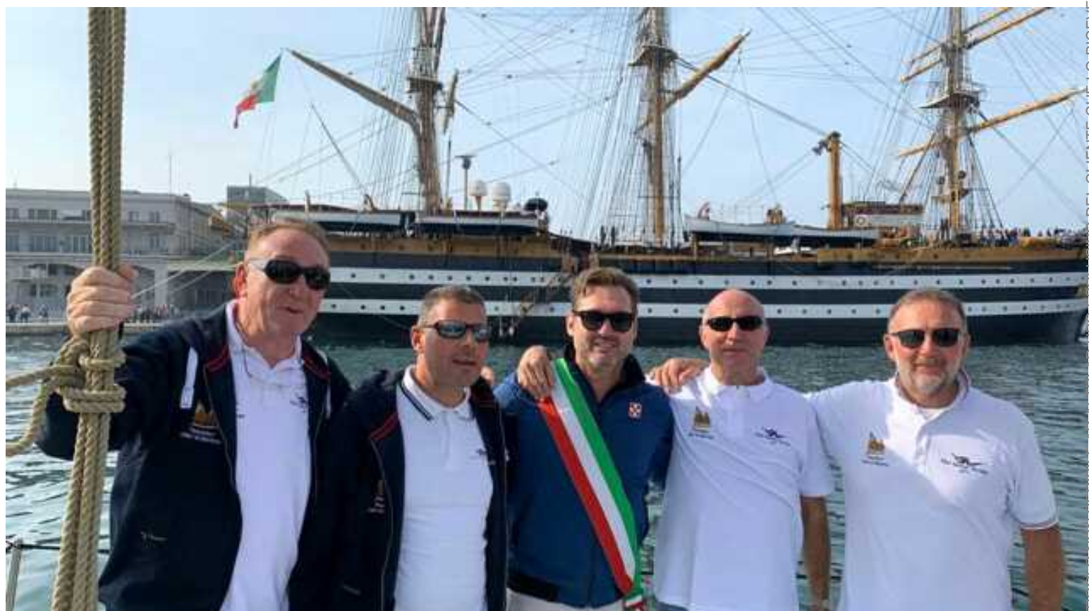
L'Amerigo Vespucci alla Barcolana 2019