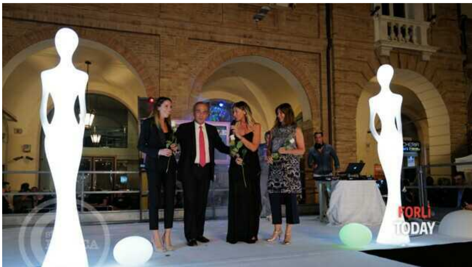
Un'immagine della passata edizione

Tutto è pronto per la terza edizione della “Sfilata di Moda Mercuriale“ che, dopo il rinvio causato dal maltempo, sarà protagonista in Piazza Saffi nella sera di venerdì, alle 21. L'evento abbina la bellezza e la creatività della moda a importanti valori civici quali l'associazionismo, la voglia di stare insieme e la solidarietà in favore dell'ospedale Pierantoni-Morgagni. Saranno oltre 40 i modelli e le modelle che sfileranno sul red carpet, accompagnati dalla verve del conduttore Andrea Vasumi, mettendo in mostra creazioni di moda affascinanti e sorprendenti.