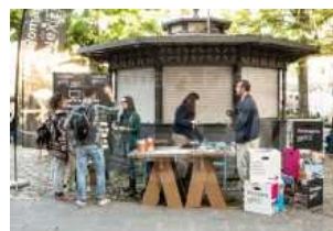
L'ufficio mobile di Romagna Next in Tour fa tappa a Lugo