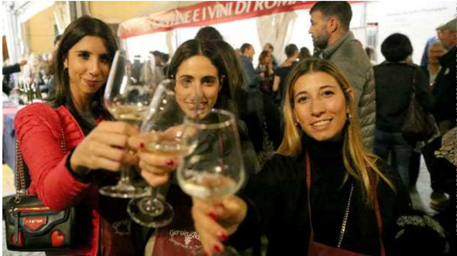
Una delle passate edizioni

“ G iovinBacco in Piazza”, la grande manifestazione enologica del Romagna Sangiovese e degli altri vini romagnoli, festeggia il traguardo dei 20 anni. Il 28, 29 e 30 ottobre il centro della città di Ravenna per tre giorni diventa teatro del buon vino e del buon cibo del territorio, con centinaia di etichette di vino, cibo di strada, punti di ristorazione, assaggi, incontri e tante cose da vedere. Per celebrare i venti anni, durante la giornata inaugurale, ci sarà la Grande Torta di compleanno in Piazza del Popolo, gentilmente offerta dall'Associazione Fornai e Pasticceri di Ravenna.