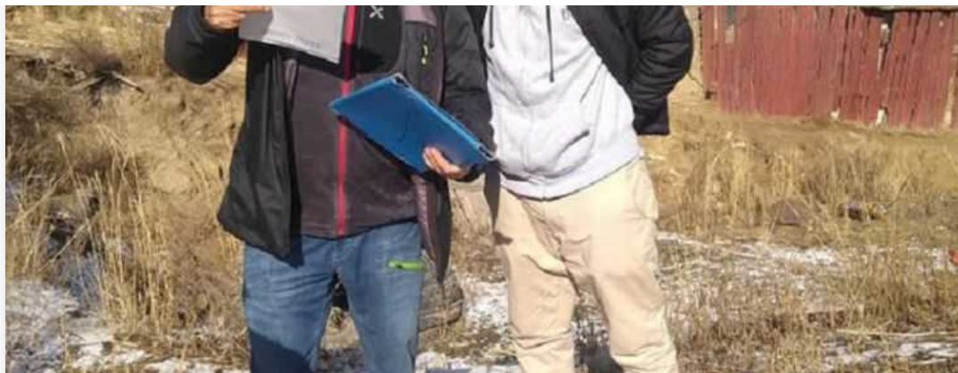
GER for life