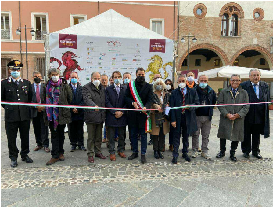
L'inaugurazione della 19 a edizione