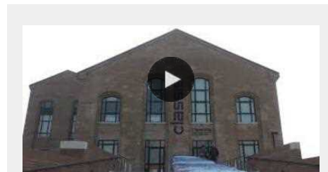
RAVENNA: Al Museo Classis e al Tamo due Cre per bambini dai 6 ai 12 anni