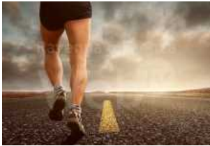
Run to win Ravenna, una camminata ludico-motoria per far conoscere le problematiche del gioco d'azzardo