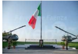
Cotignola: commemorato Giannetto Vassura nel 104esimo anniversario della scomparsa