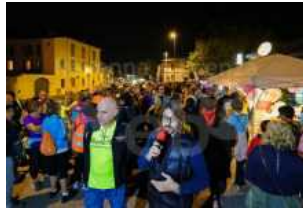
Lugo: grande successo per la "Camminata Rosa"