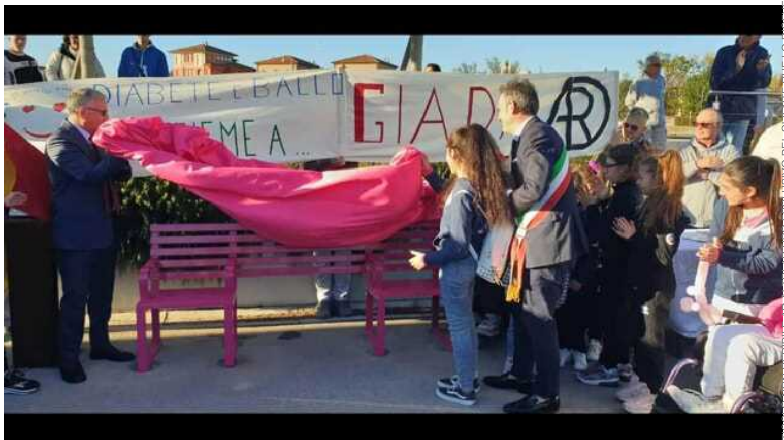
L'inaugurazione della panchina in Darsena