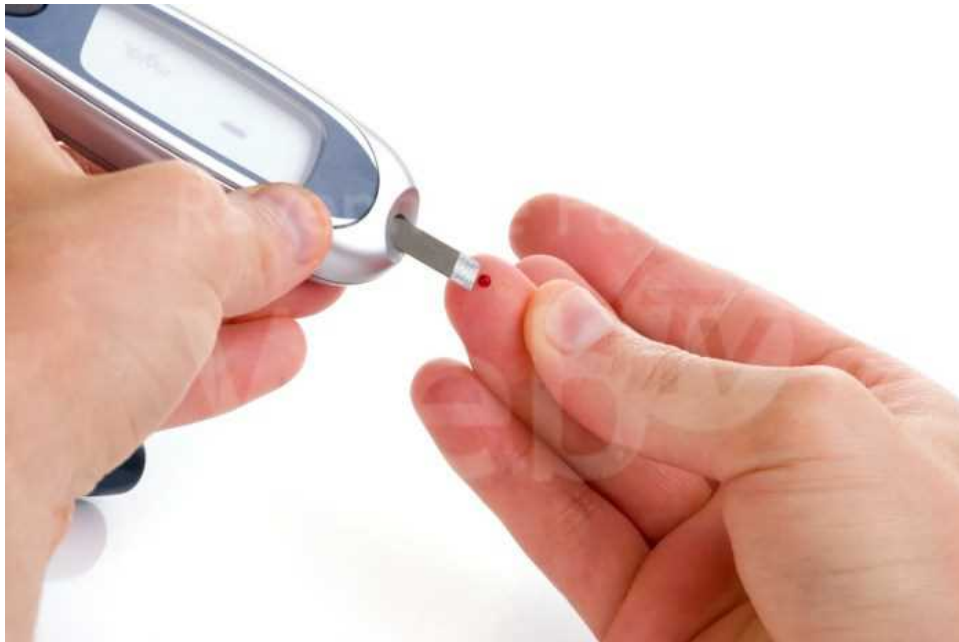
Diabetic is doing a glucose level finger blood test

Anche quest'anno, il 14 novembre , si celebrerà la Giornata mondiale del Diabete . E' passato un secolo dalla intuizione di Grant Banting, ricercatore canadese