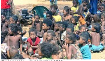
Madagascar — 11 novembre 2022