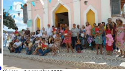
Chiesa — 9 novembre 2022