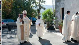
Unità Pastorale — 10 novembre 2022