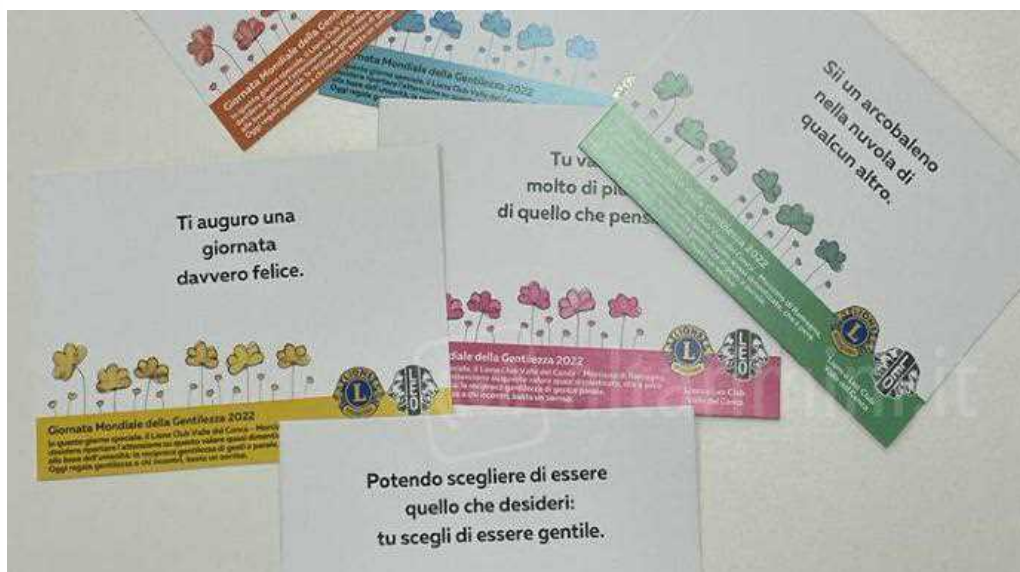
Le cartoline della gentilezza.

Nella giornata mondiale della gentilezza, il Lions Club Valle del Conca Morciano di Romagna, ha trovato il modo più semplice per farsi conoscere: una pioggia di cartoline ha invaso il centro del paese, con frasi che ricordano uno dei valori più importanti per il club: la gentilezza, l'accogliere, l'essere di servizio alle persone, per costruire una comunità più solida, unita e appunto, gentile.