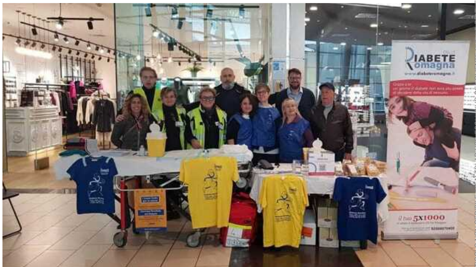
Il gruppo protagonista dello screening

In occasione della Giornata Mondiale del Diabete, il Lions Club Forlì Giovanni de' Medici, come in passato, si è fatto promotore dello screening della glicemia rivolto alla popolazione. L'iniziativa, alla quale hanno aderito anche tutti gli altri Club Lions di Forlì (Forlì Host, Forlì Valle del Bidente, Forlì Terre di Romagna ed il Club Forlì Leo), si è svolta sabato dalle 9 alle 18 all'interno del Centro Commerciale Punta di Ferro, dove, in collaborazione con l'Associazione Diabete Romagna è stata appositamente allestita una postazione, presso la quale si trovavano medici ed altri operatori sanitari. Rispetto allo scorso anno è stato possibile ampliare l'orario di svolgimento dello screening che, stante l'importanza fondamentale della prevenzione, è stato eseguito gratuitamente nei confronti di tutti coloro che hanno voluto rispondere all'offerta, così come gratuitamente è stato distribuito materiale informativo su questa patologia ancora oggi purtroppo molto diffusa.