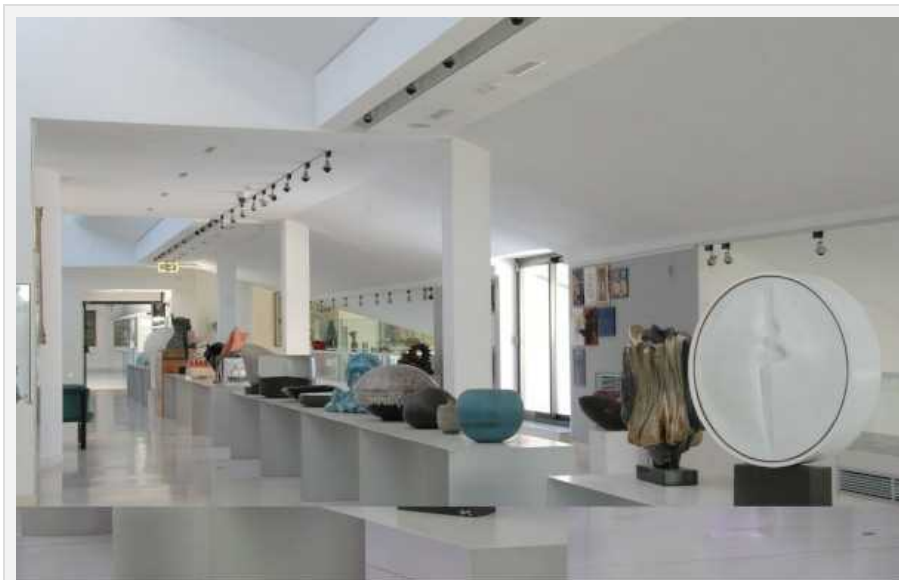
Il Museo della Ceramica di Faenza

Faenza. E’ attualmente in fase di programmazione “Aggiudicato!”, l’asta di opere organizzata da Ente Ceramica Faenza per sostenere, attraverso il ricavato, le attività di promozione e valorizzazione della ceramica faentina organizzate dall’Ente stesso.