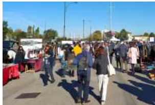
Appuntamento in Darsena domenica con La Pulce d'Acqua

Articoli correlati Di più dello stesso autore