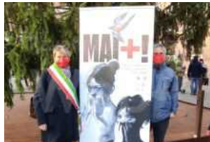
Il 19 novembre tre Comuni Ravenna, Bagnacavallo e Faenza unitamente in piazza per dire Mai+ Violenza sulle donne