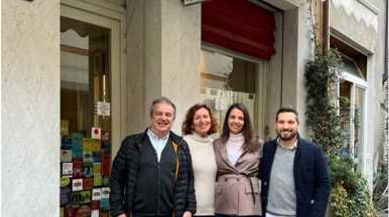
SOCIAL Cambio al timone di uno storico locale: in arrivo una cantina visitabile con oltre mille etichette