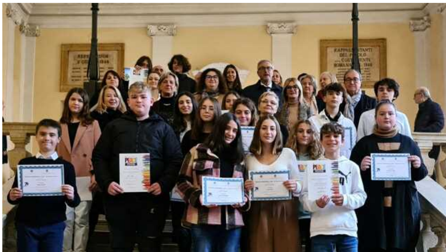
Gli studenti vincitori dell'edizione 2022