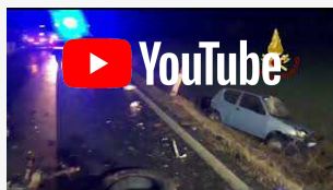
Incidente stradale sulla Canaletto, un ferito a