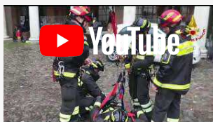
I Vigili del Fuoco di Modena festeggiano Santa Barbara