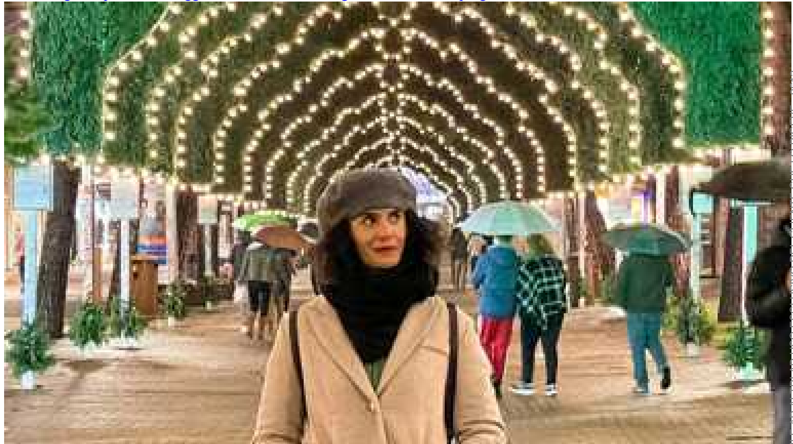
SOCIAL Da Donna Dinosaurio alle mamme influencer, il Natale sostenibile della Perla Verde sbarca sul web