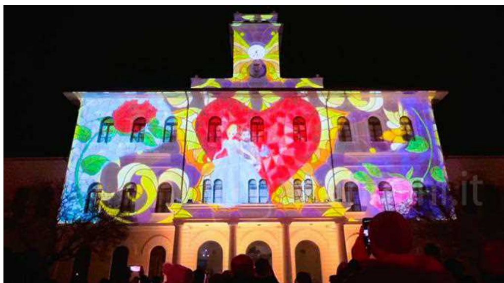
Video mapping a Palazzo Mancini, Cattolica.

Messo in archivio il Capodanno, le iniziative della "Regina di ghiaccio" proseguiranno sino a domenica 8 gennaio. Sino a quella data, infatti, si avrà modo di passeggiare tra le casine del mercatino eno-gastronomico, piene di golosità, di "luvarie", del mercatino del bosco ghiacciato . Da Piazza Nettuno lungo viale Bovio e via Matteotti, nel tratto sino via Corridoni, le casine rimarranno aperte infrasettimanalmente le 15.00 e le 20.00 e nel weekend tra le 11.00 e le 22.00.