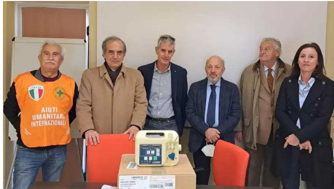
Pandori in dono agli anziani e aiuti concreti a chi ha bisogno

Boom di iniziative benefiche nel periodo delle feste. Donate anche strumentazioni mediche a una donna malata