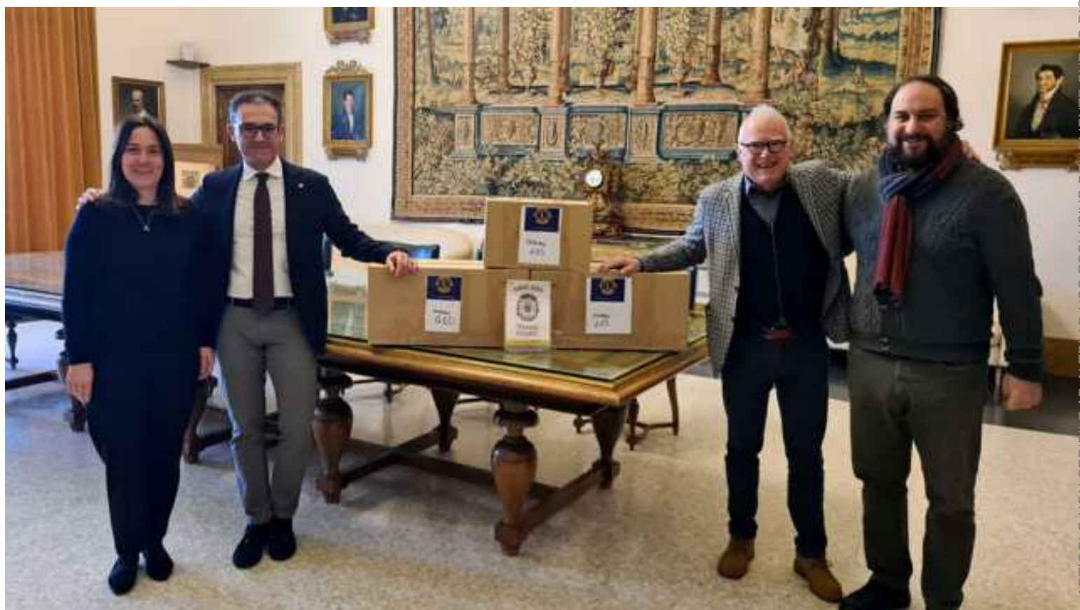
I referenti dell'iniziativa accanto agli scatoloni di materiale raccolto

Circa 1.300 paia destinate alle persone più svantaggiate. È il dato complessivo dell'iniziativa di raccolta di occhiali usati che si è sviluppata a partire da giugno 2021 - su impulso dei Lions Club Ferrara Estense, Ferrara Host, Santa Maria Maddalena Alto Polesine, Ferrara Ducale e Ferrara Diamanti, in collaborazione con Afm Farmacie Comunali, e con il patrocinio del Comune di Ferrara - per aiutare in modo concreto le persone in condizioni socio-economiche gravose, al punto da non potersi permettere l'acquisto di uno strumento ottico.