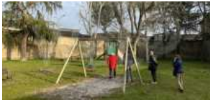
Bagnacavallo: Il Parco delle Cappuccine riaprirà il 20 marzo dopo la chiusura invernale