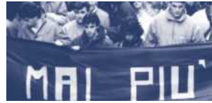
Le Acli ricordano i 13 lavoratori della Meccavi