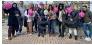
Quartiere Alberti: Ravenna prima in Italia nell'adesione alla campagna contro l'endometriosi