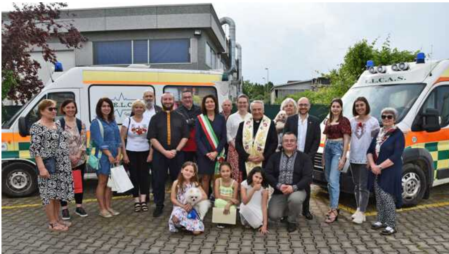
Un momento della festa

Sabato la sede la Cooperativa Sociale Elcas di Forlì ha ospitato la festa conclusiva del progetto "Salvar Car". Si tratta di una raccolta fondi, avviata lo scorso 28 marzo sulla piattaforma IdeaGinger dall'associazione San Giuda Taddeo, espressione della comunità ucraina in Romagna, finalizzata all'acquisto di un'ambulanza da inviare all'ospedale di Zhytomyr in Ucraina. L'obiettivo era di giungere alla cifra di 8.070 euro, che in realtà è stata ampiamente superata, tanto che la campagna è stata chiusa il 10 maggio con la cifra di 10.201 euro.